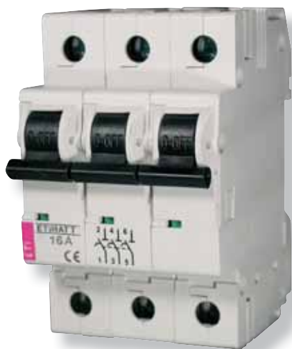
ETIMAT T 3p