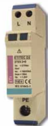
ETITEC D2 275/5 2+0