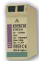
Moduł wymienny ETITEC D2 275/5 2+0